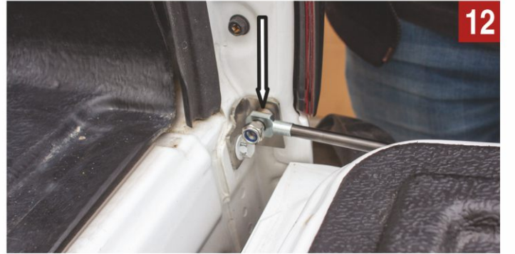
Amortisörün mil (ince) kısmını kasaya sabitleyiniz.