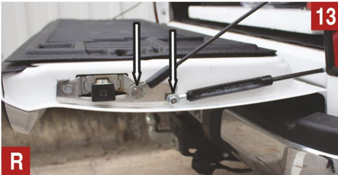
Ürünle birlikte gönderilen civata ile halatı kasa kapağına sabitleyiniz. Amortisörün kovan (kalın) kısmını kapağa sabitleyiniz.