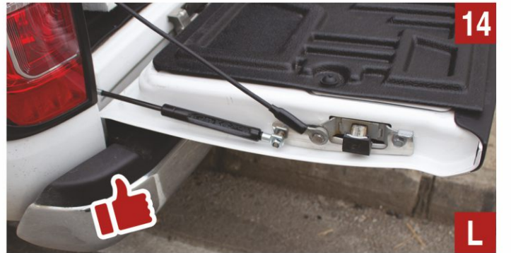
Güle güle kullanın.