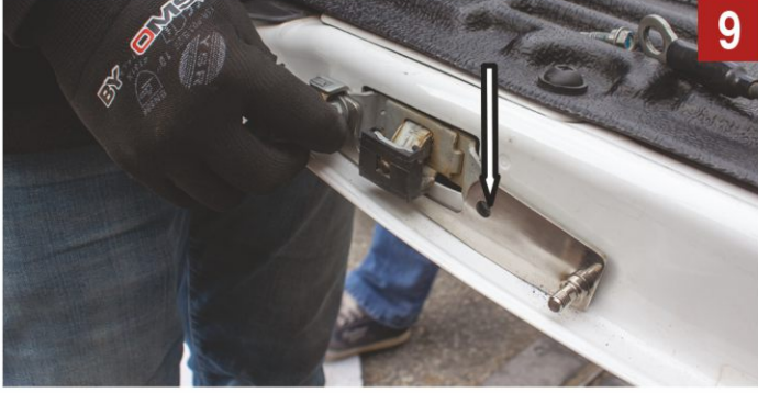
Resimdeki aparatı kapağın sağ tarafına sabitleyiniz.