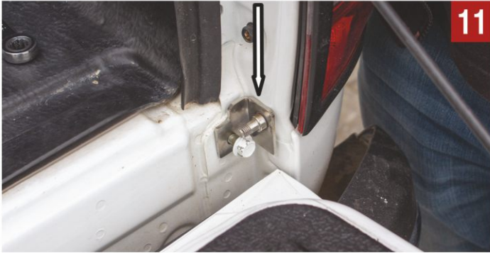
Sağ aparatı sabitleyiniz.