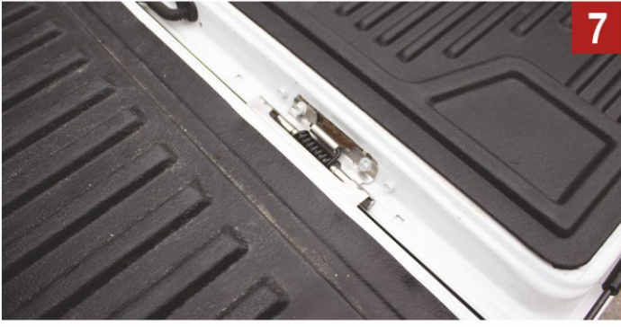
Menteşenin bitmiş hali.