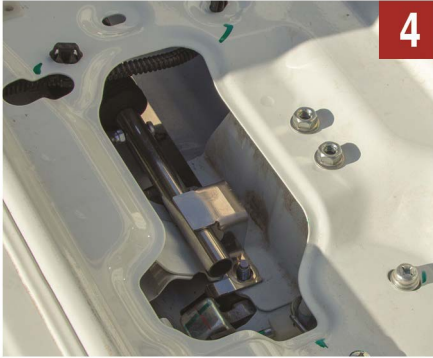
4 Mekanizmayı resimdeki gibi ayarlayınız.