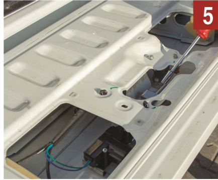
5 Mekanizmayı resimdeki gibi montajlayıp bağlayınız.