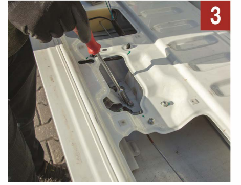
3 M10 lokma anahtarla kilit civatalarını sökünüz.