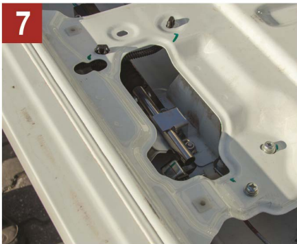
7 Bagaj kilidinin çalışmasını kontrol ediniz.