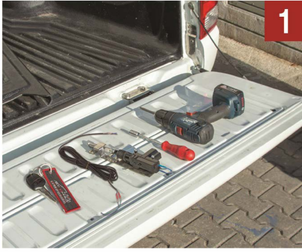
1 Montaj seti