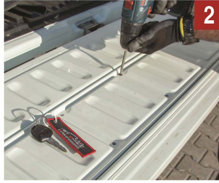
2 Üst bagaj kapağını açın.