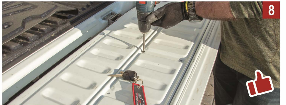
8 Bagaj kilidinizi kumandadan kontrol ettikten sonra bagaj üst kapağını kapatınız.